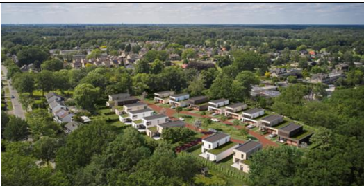
Villapark De Bolhaar, Enschede