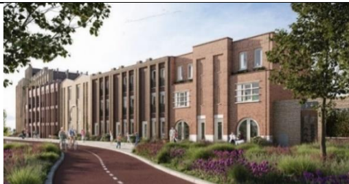
De Kroon op Leeuwesteyn, Utrecht

De Jury heeft overwogen om, los van de nominaties die leiden tot de winnaar, eervolle vermelding toe te kennen. Bij een gering aantal van de voorgedragen projecten hebben de ontwikkelaar en de makelaar namelijk vooruitstrevende stappen gezet. Omdat deze niet passen binnen de richtlijnen waarvoor de NVM Nieuwbouwprijs is ingesteld, werd daar van afgezien.