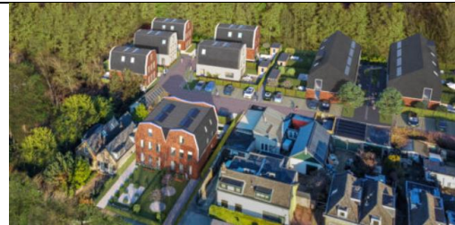
Boss, Capelle aan den IJssel