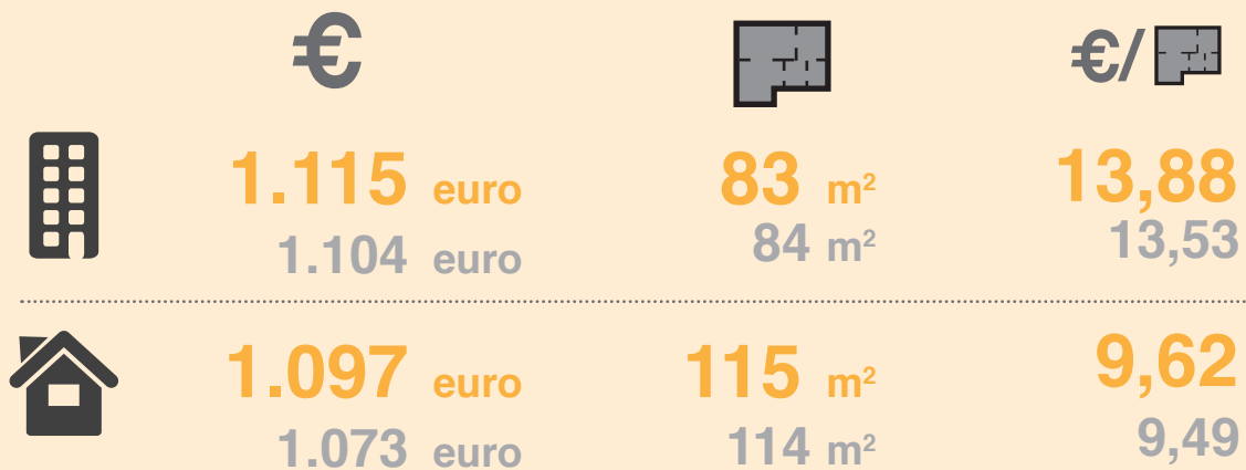
Ontwikkeling huurprijs per m2 gestoffeerd en gemeubileerd